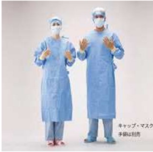
サージカルガウン (医療用)