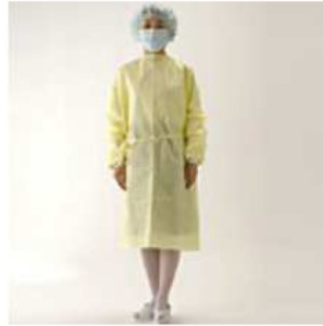
アイソレーションガウン (医療用)